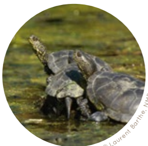
Cistude d'Europe