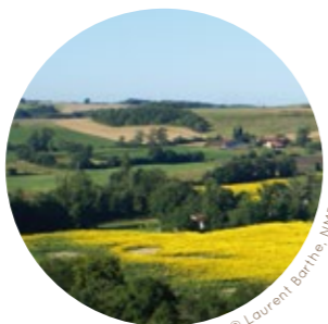
Paysage gersols