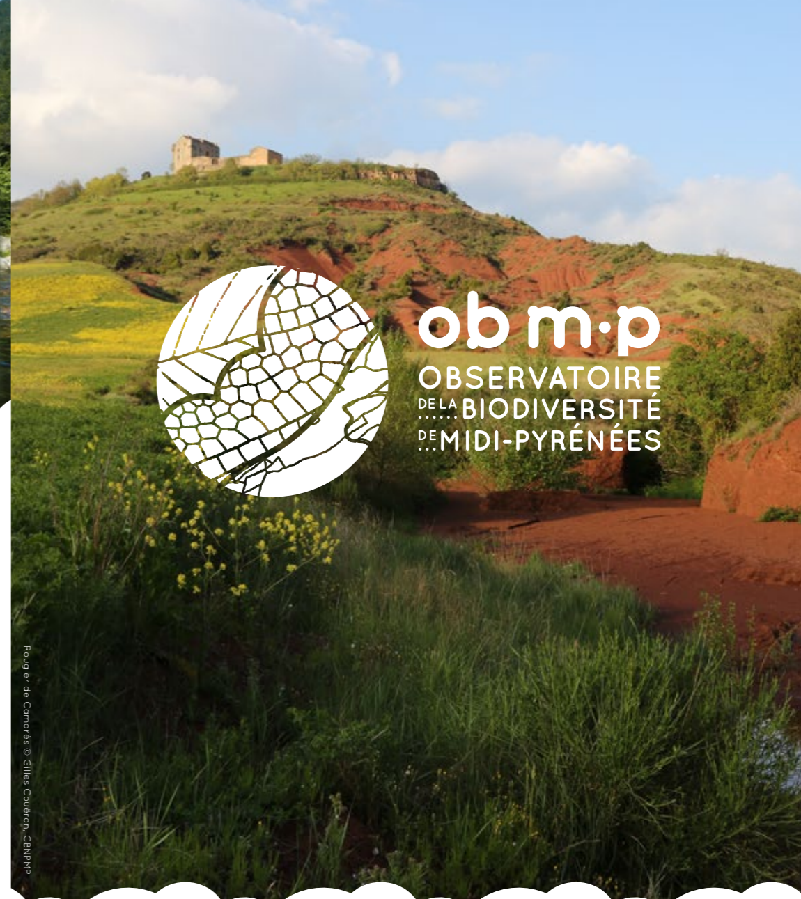
Conception graphique : www.cathycombarnous.fr / 2016 Rougier de Camarés

ob m·p OBSERVATOIRE DE LA BIODIVERSITÉ DE MIDI-PYRÉNÉES