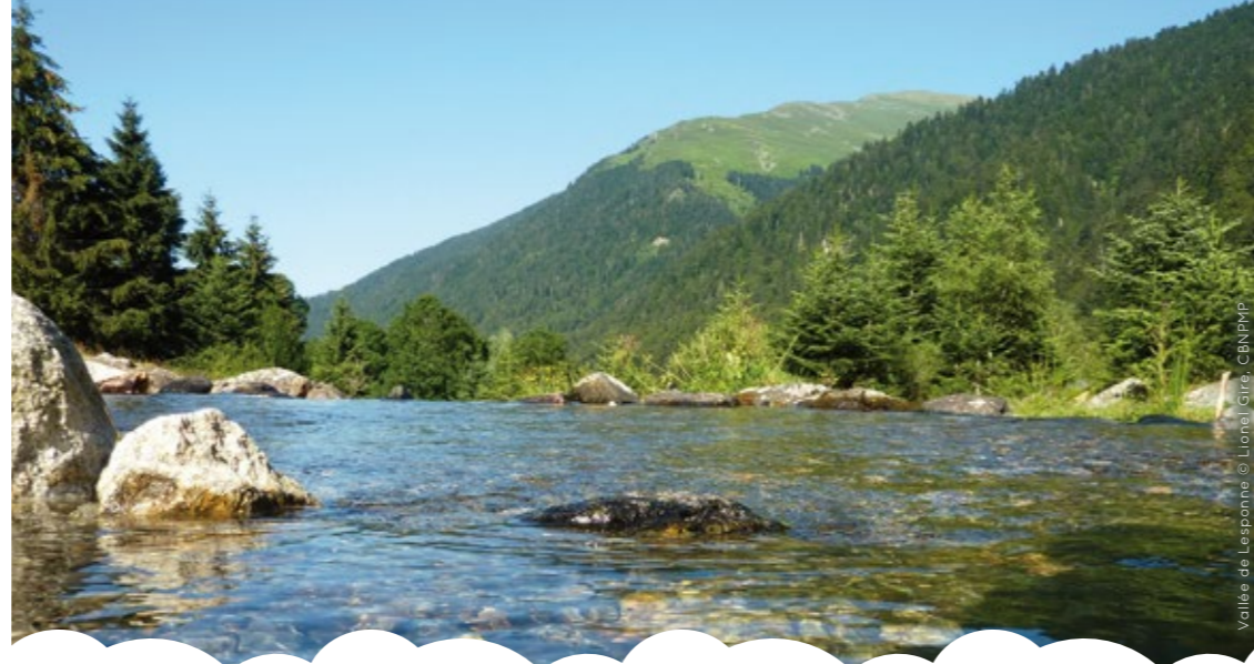
Valle de Lesponne

Pour suivre au plus près cette biodiversité, aider à son appropriation et à sa prise en compte, l'Observatoire de la biodiversité de Midi-Pyrénées (OB MP) a été créé.